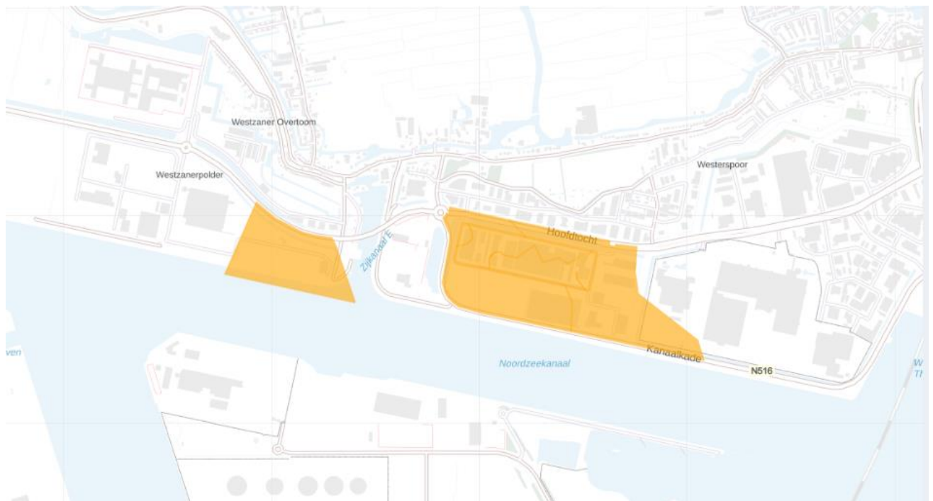
Figuur 2: Kaart van het congestiegebied.

Het congestiegebied staat weergegeven in de kaart en de lijst met postcodegebieden hieronder.