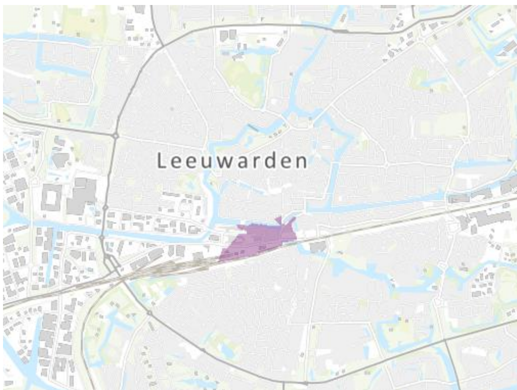
Figuur 1: Kaart van congestiegebied

Het congestiegebied staat weergegeven in de volgende kaart.