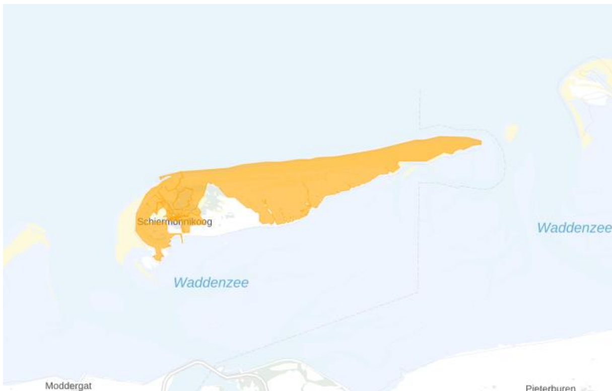
Figuur 4: Kaart van het congestiegebied.

Het congestiegebied staat weergegeven in de kaart en de lijst met postcodegebieden hieronder.