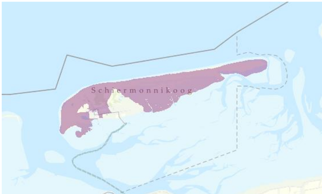
Figuur 2: Kaart van het congestiegebied.

Het congestiegebied staat weergegeven in de kaart en de lijst met postcodegebieden hieronder.